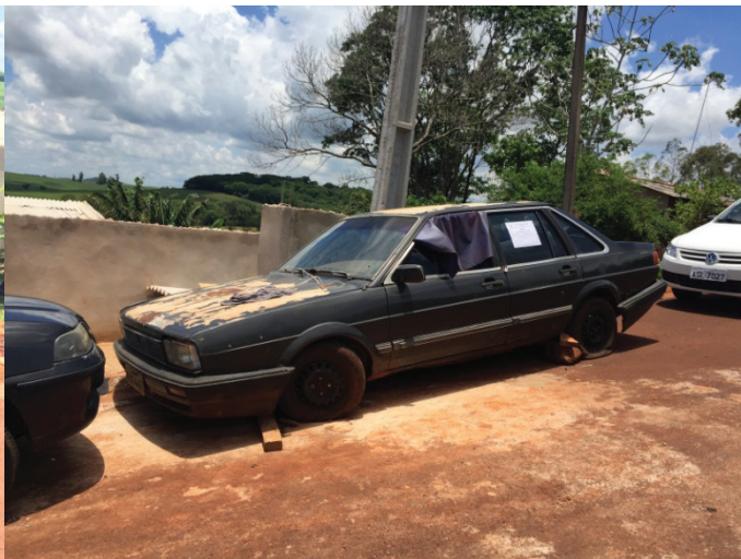
50) Marca: VW Modelo: VOYAGE LS ICP-Brasil Tipo A3 - Emitido por AC SERASA RFB V2 - Emitido para: Município de Ibiporã: 76.244.961/0001-03 - NS: 49EB90C54A6F20CF