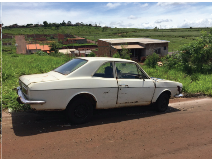
30) Marca: FORD Modelo: CORCEL Ano de Fabricação: 1975 Placa: ABA-8738 Local onde está estacionado: Rua José Gâmbaro - Quadra 20 Lote 08 Beltrão Park Residence.